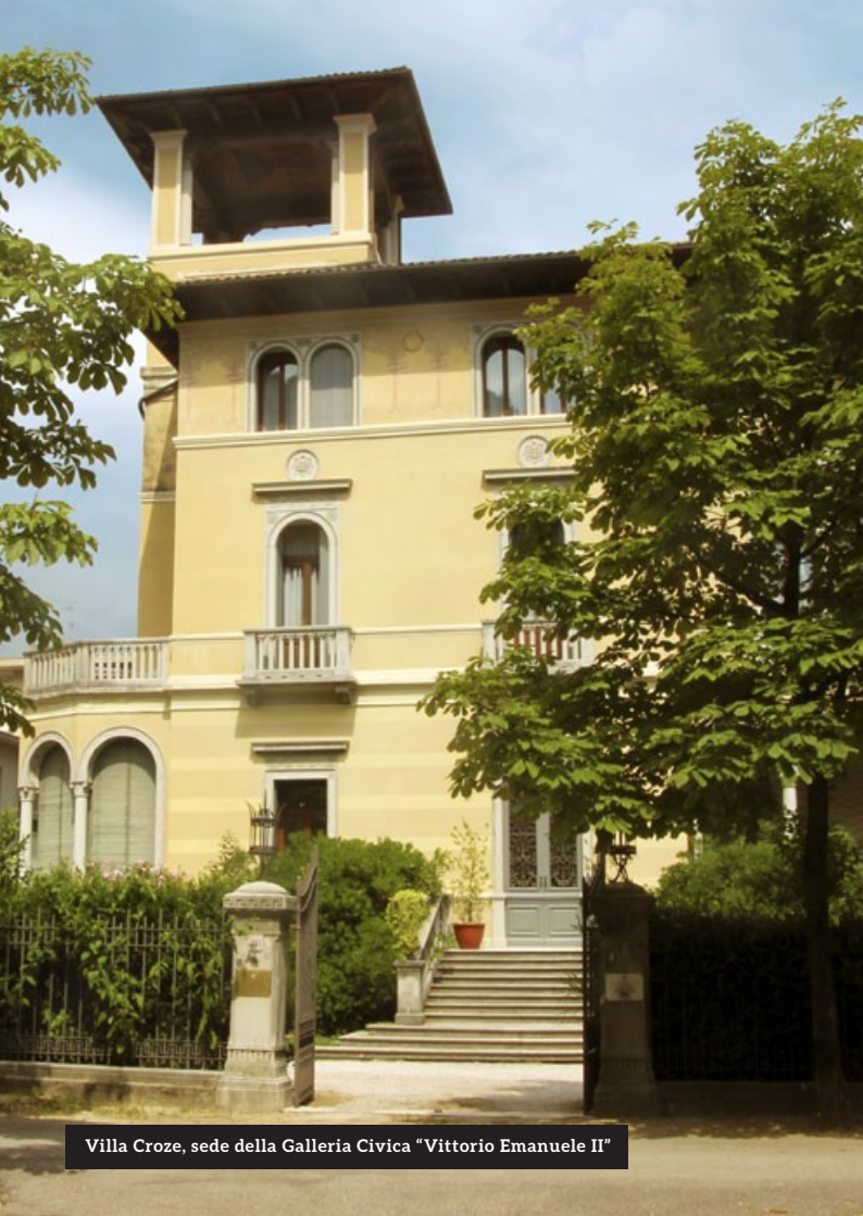
Villa Croze, sede della Galleria Civica "Vittorio Emanuele II"